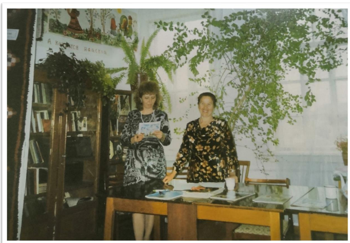
Литературная гостиная по творчеству А. Ахматовой.