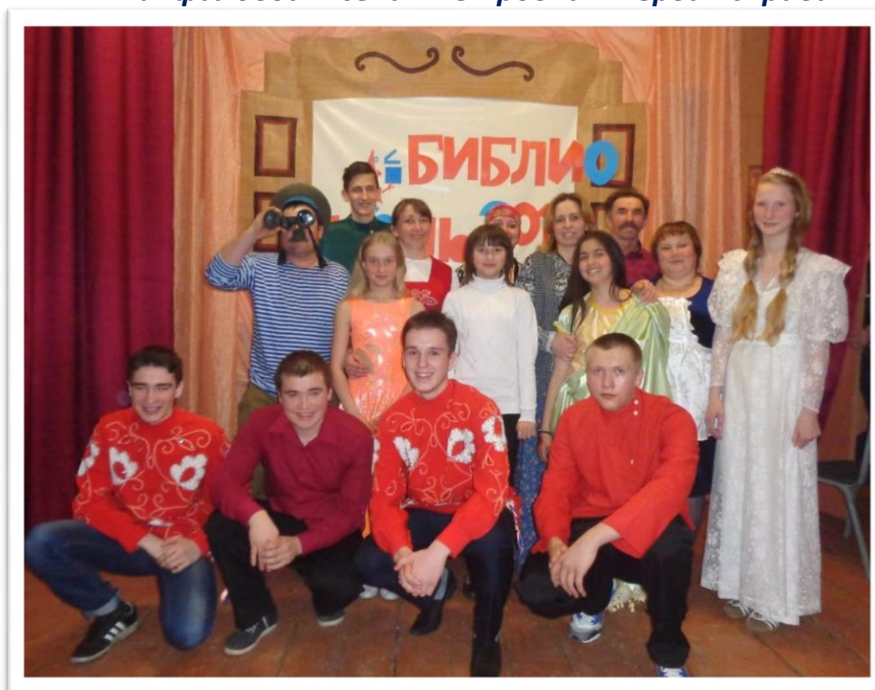
Всероссийская акция «Библионочь – 2016»