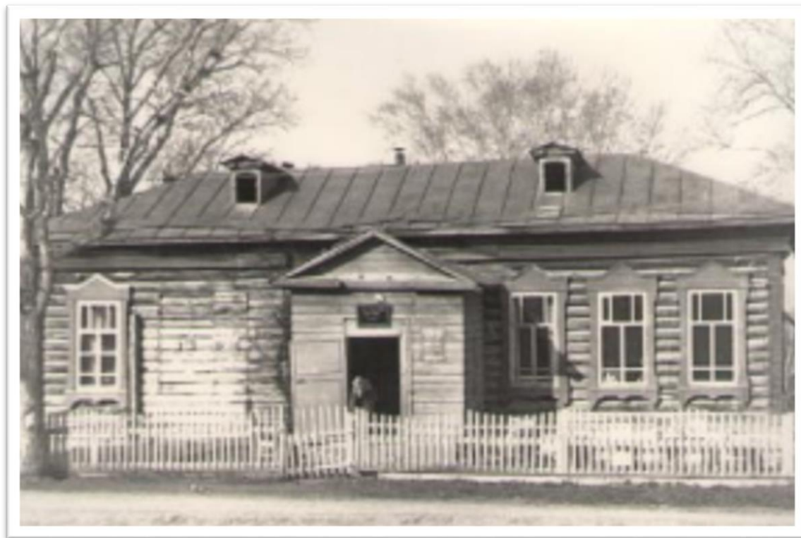
Тастубинская сельская библиотека в 60-х г.г.