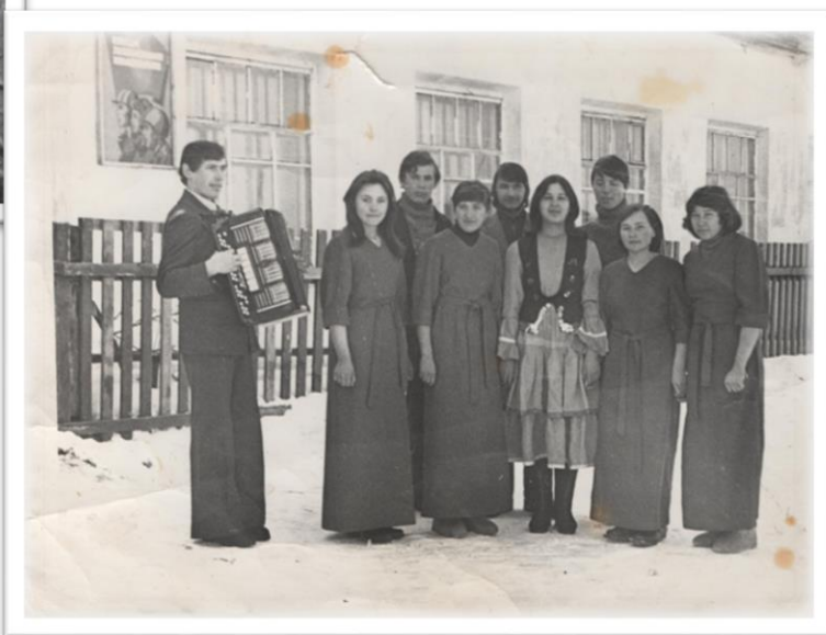
Молодежный вокальный ансамбль возле здания клуба

В 1972 году заканчивается строительство нового здания сельского дома культуры, в котором выделяется помещение и для библиотеки. Для книг мастерят новые деревянные стеллажи. Здание отапливается несколькими круглыми печами. Найля Кашбулловна является участником всех культурных и общественных мероприятий села, отлично знает русский язык, и её в 1975 г. переводят на должность секретаря сельского совета.