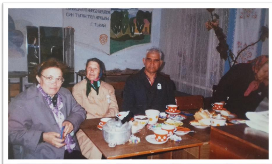
Встреча ветеранов-библиотекарей в 1999 г.

В 2011 г. после выхода Ягудиной Р.Р. на заслуженный отдых, библиотеку принимает Райханова Лилия Билградовна. На сегодняшний день фонд библиотеки составляет более 13 тыс. книг. В 2021 году число читателей составило 750 человек; посещений -8579; книговыдача – 12800 экз., проведено мероприятий за год - 99.