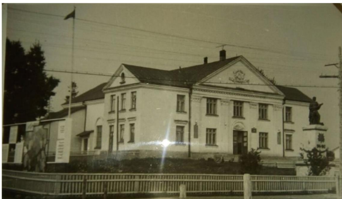
В начале 70-х годов библиотека переезжает в новый СДК, где и находится по сей день.