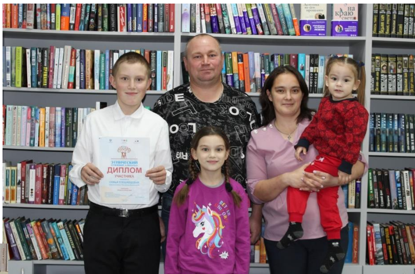
Семья Плешивцевых, участники Общероссийского конкурса «Этнический семейный альманах»