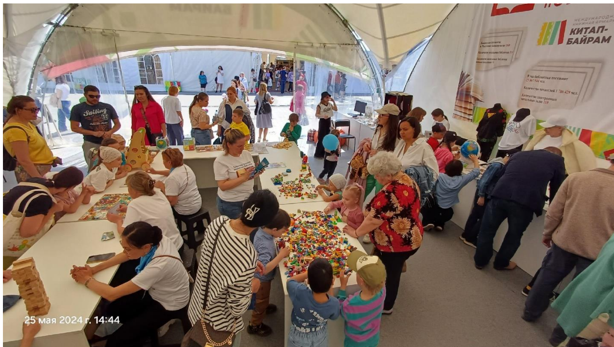
25 мая 2024 г. 14:44

В Уфе с 24 по 26 мая проходила II Международная книжная ярмарка «Китап-Байрам». В масштабном событии принимали участие более 220 издательств из 18 субъектов России и стран ближнего зарубежья. В книжном празднике приняли участие модельные библиотеки Башкортостана, в том числе Дуванская зональная модельная библиотека. Команда из 6 библиотекарей Дуванской зональной модельной библиотеки и Месягутовской центральной межпоселенческой библиотеки представляла на ярмарке интерактивное и игровое оборудование модельной библиотеки, новые форматы книг. Проводили игры и мастер-классы.